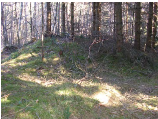
Jedna z nalezených mohyl „V Kluzí“, stav duben 2011.

Další skupina 7 mohyl, zřejmě ze stejného období, se našla později 100 m opodál. Z toho byly 3 neporušené a 4 porušené. Některé mohutné násypy mohyl dosahovaly výšky až 2 m a šířky 3 - 7m. Našlo se i několik výrazně oválných mohyl, které byly v několika případech obklopeny zřetelnými, až 80 cm hlubokými příkopy. Jedna z menších porušených mohyl byla prozkoumána v r. 1995. Měla průměr kolem 7 m a původně dosahovala zhruba metrové výšky; v roce předcházejícím ji totiž někdo barbarsky rozkopál. Naštěstí se ve svém „zlatokopecském“ snažení soustředil jen na vykopání středové „vykrádací“ šachty. Výsledky výzkumu nebyly tudíž zanedbatelné. Objeven byl velice výrazný kamenný „věnec“ i dřevěný „dům mrtvého“. Jeho nároží směřovala do hlavních světových stran, „stěny“ byly tvořeny až čtyřmi pásy zuhelnatělého dřeva. V blízkosti symbolického domu byly na 25 místech rozptýleny skupiny drobných spálených lidských kostí