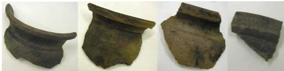
Část nalezených úlomků keramiky ze 13. století pochází z bývalé tvrze.

Všechny nálezy jsou dnes ve sbírkách prachatického muzea. Mezi spoustou keramických střepů ze 13. století je i miniaturní plastika pocházející ze sondy, která byla provedena v těsné blízkosti bývalé tvrze v zahradě čp.2. Torzo keramické sošky má do detailu precizně provedený obličej a podle všeho představuje muže. Její stáří není prozatím určeno.