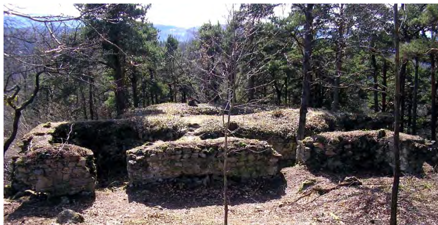
Pohled na zbytky paláce hradu Osule, foto 2012.