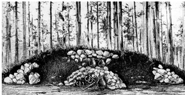
Mohyla - průřez.

Nad „Toncárů polema“, na severním okraji lesa „V Kluzí“, bylo při terénním průzkumu v r. 1986 nalezeno celkem 18 mohyl. Z celkového počtu jich byla polovina zachovalých, polovina pak porušených. Dostupná literatura však uváděla pouze 15 mohyl. Mohyly pocházející z 8. - 9. století byly uspořádány do nepravidelných řad. Jednu mohylu již před lety zkoumal jihočeský archeolog B. Dubský (*1880-†1957).