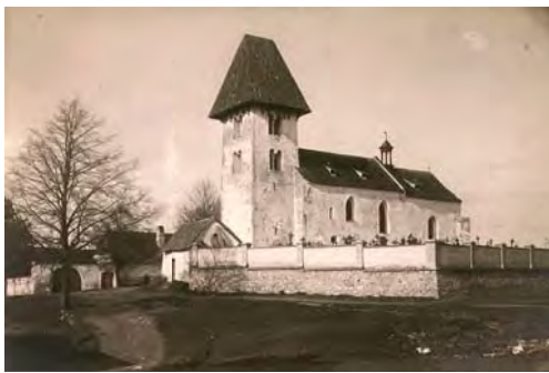
Kostel sv. Mikuláše v Boleticích je údajně nejstarší památka jižních Čech, pochází z 12. století.

Dalším úderem pro Vítkovce bylo založení královského města Budějovic. První práce na založení Budějovic započaly nejspíše r. 1263. Buděje se ale zakládací listina nedochovala, datuje se založení města k 10. březnu 1265, kdy bylo předáno staveniště kláštera dominikánům tzv. Hirzovou listinou.