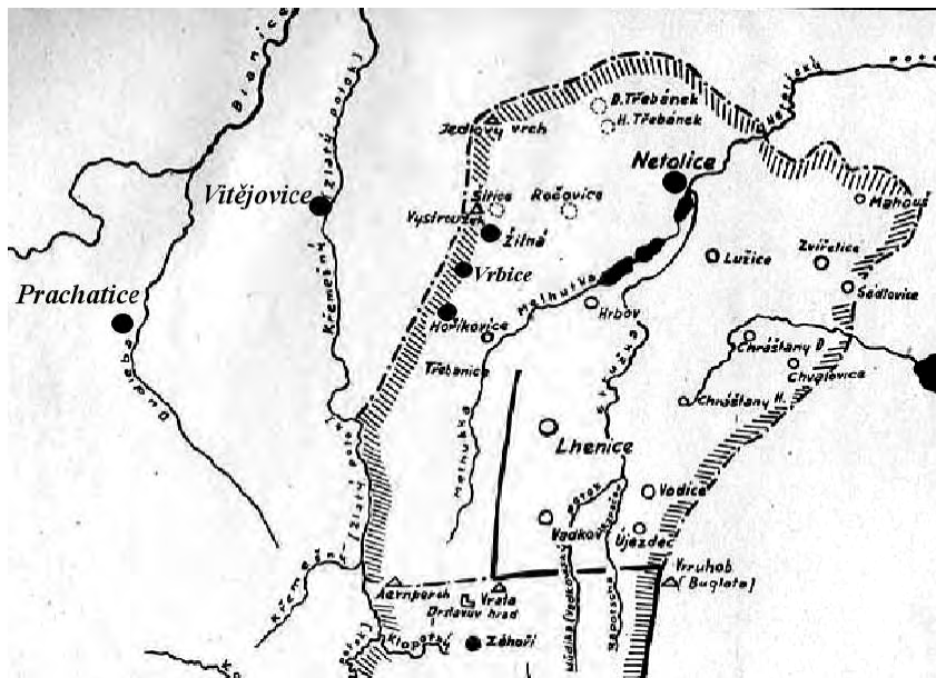
Výřez z mapy zlatokorunského klášterství z r. 1263.

(A.Sedláček – Snůška starých jmen, kapitola VIII.,str.41-42,1920)