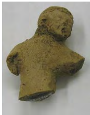
Nalezené torzo keramické sošky o velikosti 4,5 cm.

(M.Parkman - Obecní hlína skrývá tajemství předků, Listy Prachaticka, č.148, str.18, 2005)