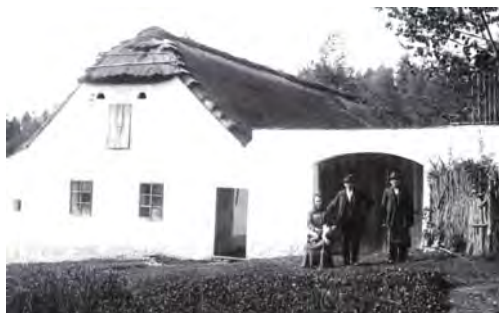
„Kouťáků“ chalupa s doškovou střechou, foto 10. květen 1914.

Velký požár vypukl ve Vitějovicích 5. listopadu 1701, kdy vyhořelo 9 domů. Ohni padly za oběť zásoby obilí a slámy. Další požár ze dne 21. ledna 1720 si vyžádal i jeden lidský život. V ohni tehdy zahynul vitějovický Šimon Stejkoza. Dne 24. listopadu 1787 vypukl další požár, kdy shořelo ve vsi 7 domů.