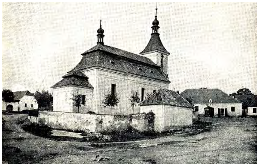
Kostel sv. Markéty ve Vitějovicích, foto z r. 1903.

Rok před příchodem prvního faráře, v r. 1746, stál v obci Vitějovice barokní kostel s hranolovitou věží, zakončenou jehlancovitou střechou, jenž se od těch dob stal dominantou celé návsi.