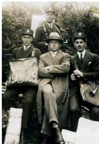
Pošťáci z Vitějovic v r. 1929.