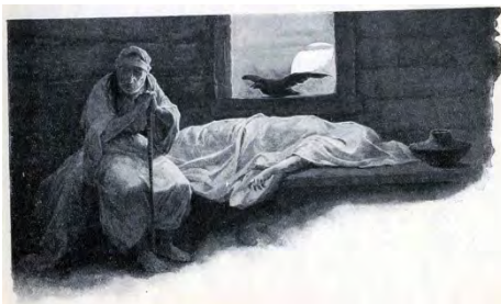
Obraz Věnceslava Černého.

Den plynul, jak měl, přišel večer a v rychtářovic stavení se po celodenní lopotě chystali na kutě. Chystal se i Sepp. Jenže spaní neměl valné. V noci na něj přišla horkost a bolení a ráno vůbec nedokázal vstát z postele. V poledne pak bylo ještě hůř a navečer se rychtář pomalu chystal za zvoníkem, že bude muset rozhoutat Barborku, aby se rozloučila s chlapcovým žitím.