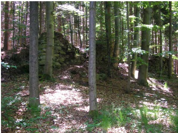
Zbytky myslivny „Svalený Jägerhaus“.