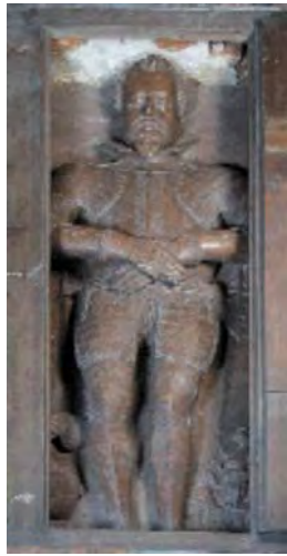
Náhrobek Jana Zrinského ve Vyšším Brodě.

potravin rostly. Poddaní kromě vojenských útrap museli snášet vykořisťování ze strany svých hrabivých vrchností.