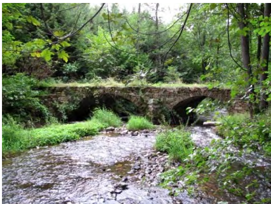
Kralovický most ze 16. století.

Přímo ve Vítějovicích je zajímavou kulturní památkou „Kleinův“ mlýn s barokním jádrem a ozdobnými vjezdy, taktéž ze 16. století. Další zajímavý kamenný most pak překlenuje koryto Zlatého potoka v Protivci. Tato významná technická památka pochází nejspíše až z 18. století. Průčelí mostu jsou neomítnuta a klenby postaveny z cihel.