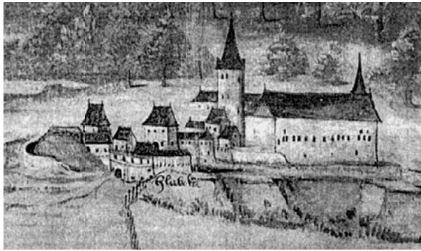
Hrad Hluboká v době okolo 16. století na výřezu dobové veduty.

Abychom mohli zvážit Přemyslovu účast na stavbě hradu na Osuli, musíme se dotknout králova vztahu k jižním Čechám a jeho zdejšího působení. Otakar II. do oblasti, kterou Vítkovci považují za vlastní, několikrát hrubě zasáhl ve snaze prosadit zde svoji autoritu. Již v r. 1263 je zahájen klášterní život ve Zlaté Koruně. Dalším počinem, který je třeba chápat jako výspu královy moci v nitru vítkovských držav, je vznikající pevnost na Osuli. Budování hradu nad Vitějovicemi plně zapadá do kontextu ostatních zakladatelských podniků Přemysla Otakara II. v tomto kraji. Jeho prvním opěrným bodem poblíž Krumlova je tedy Zlatokorunský klášter a dále od nejcitlivějšího místa pak hrad Osule. Možnou souvislost obou stavebních podniků naznačuje okolnost, že v r. 1263 nebyl dán rozsáhlý netolický