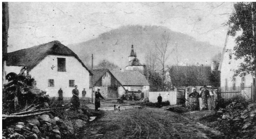
Vitějovice kolem r. 1920.