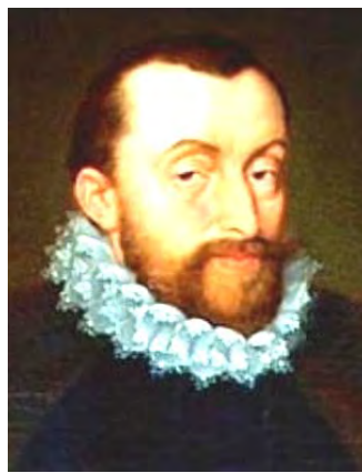
Petr Vok z Rožmberka.

Stárnoucí Petr Vok (*1539-†1611) na sklonku života předal svému synovci celé panství ve snaze zajistit kontinuitu a pokračování odkazu slavného rožmberského domu. Ve své poslední vůli z dubna 1610 odkázal celé panství Janu Zrinskému ze Serynu (*1565-†1612), který po své matce Evě z Rožmberka v sobě nosil poslední rožmberskou krev. V poslední vůli byla však výhrada, že kdyby zemřel, má panství připadnout Janu Jiřímu ze Švamberka. Jan Zrinský přežil svého strýce o pouhé 3 měsíce a v únoru 1612 velmi záhy zemřel. Naděje Petra Voka tak nebyly naplněny a rožmberská historie skončila.